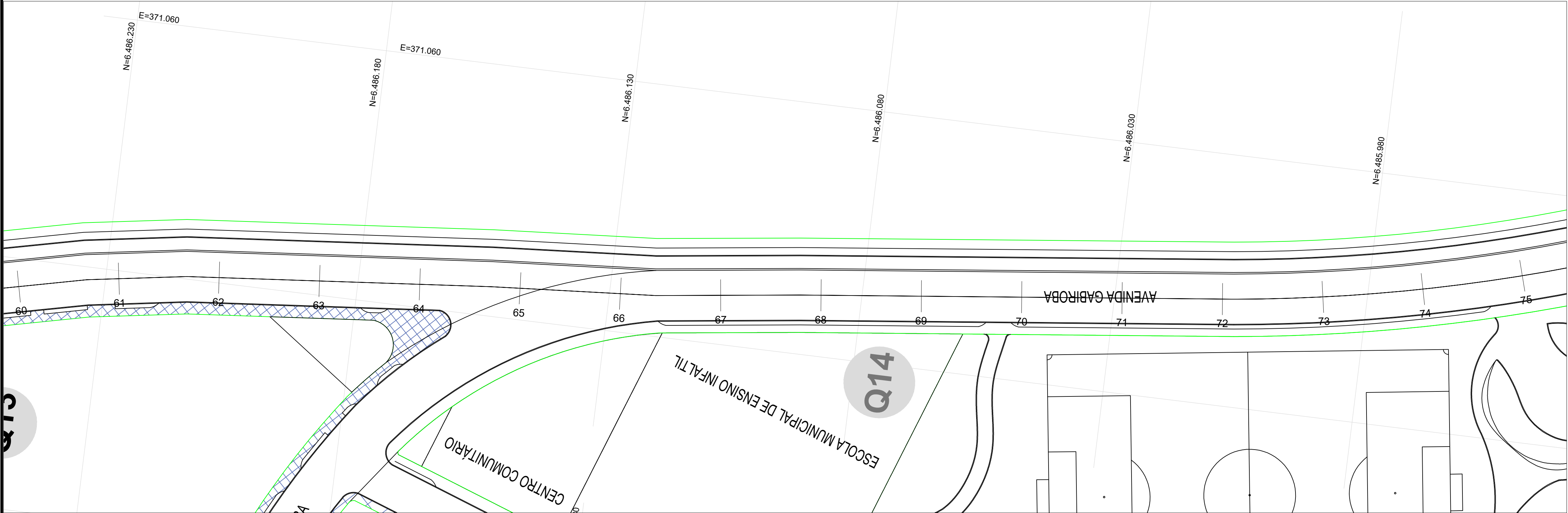
PLANTA BAIXA ESC. 1:500